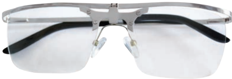
Up and Down argento con lenti abbassate

Gli occhiali per lettura unici al mondo!