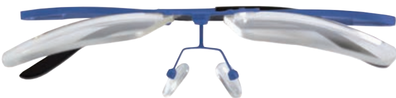
Up and Down blu con lenti sollevate