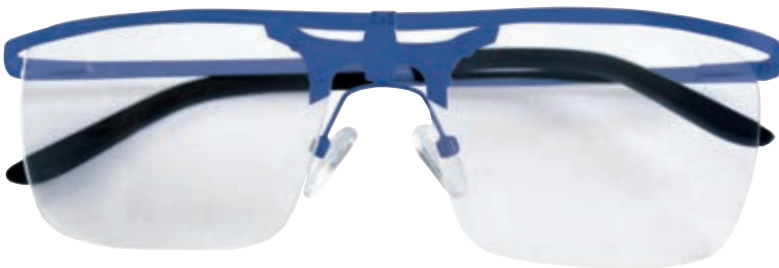
Up and Down blu con lenti abbassate