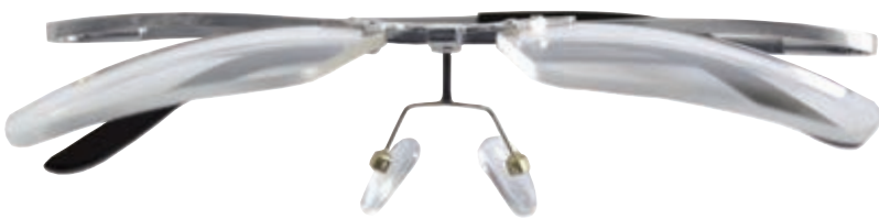
Up and Down argento con lenti sollevate